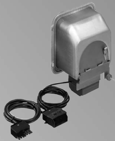
Vitoair (для встраивания в стенку дымовой трубы)