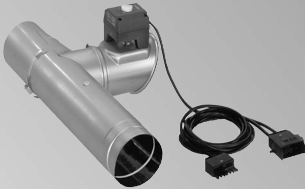
Vitoair (для установки в трубу дымохода)