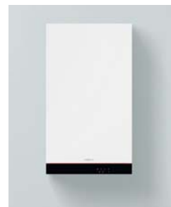
Vitodens 050-W (Тип В0НА та В0КА)

Vitodens 050-W були випробувані та схвалені для використання природного газу відповідно до EN 15502. Заміна в межах газових груп E / LL / Lw / K не потрібна.