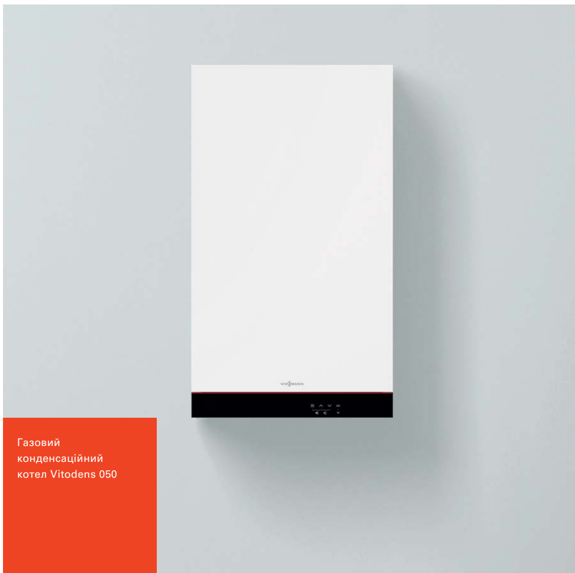
Газовий конденсаційний котел Vitodens 050

Особливо вигідне поєднання якості та ціни VITODENS 050-W (Тип ВОНА/ВОКА)